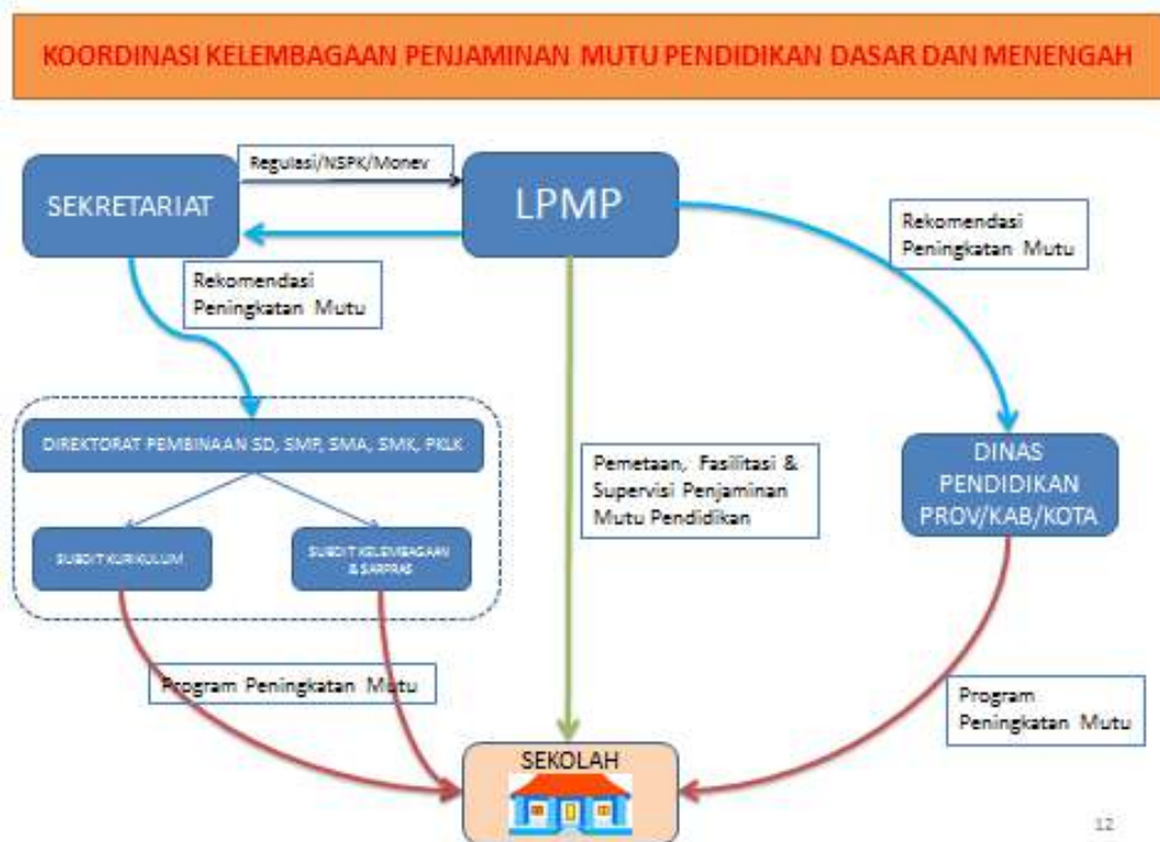
Bagan 3.4. Bagan sistem dan koordinasi kelembagaan penjaminan mutu pendidikan

Berdasarkan ketiga bagan di atas, LPMP memiliki tugas utama dalam penyelenggaraan proses penjaminan mutu pada tingkat satuan pendidikan, yang dimulai dari alur peta mutu dan pemetaan mutu yang menghasilkan rapor mutu, penyelenggaraan sistem penjaminan mutu internal dan eksternal di satuan pendidikan dan melakukan supervisi dan fasilitasi pencapaian dan pemenuhan 8 SNP serta ikut serta dalam memfasilitasi penyelenggaraan kurikulum 2013. Secara struktur sistem dan koordinasi kelembagaan penjaminan mutu pendidikan dapat dilihat pada skema berikut: